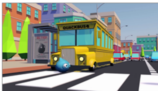
A piedi: visibilità limitata davanti al bus