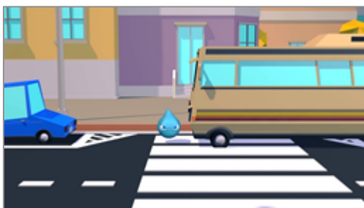
A piedi: visibilità limitata da un veicolo in sosta