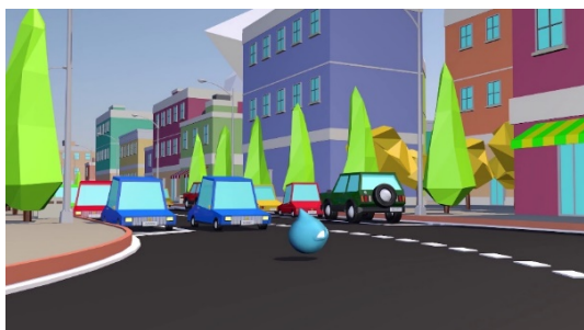
A piedi: attraversamento in curva