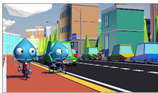
In bicicletta: uscita dalla corsia ciclabile