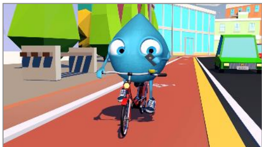
In bicicletta: uso del telefono cellulare