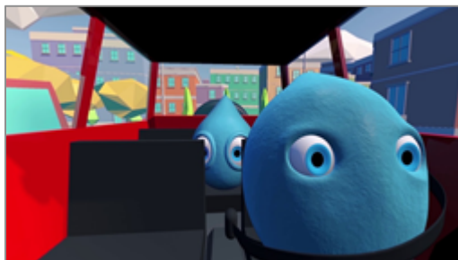
In auto: uso delle cinture di sicurezza